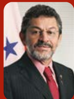
Por Senador Paulo Rocha (PT-PA)

Nos próximos meses, serão injetados R$ 3,8 bilhões no setor. Trata-se da maior transferência de recursos para a cultura nacional da história! Daí a importância de mostrarmos, com passo a passo, como ter acesso à verba. Espero que esta cartilha auxilie a todos e todas em suas diversas etapas de implementação até a devida utilização dos recursos.